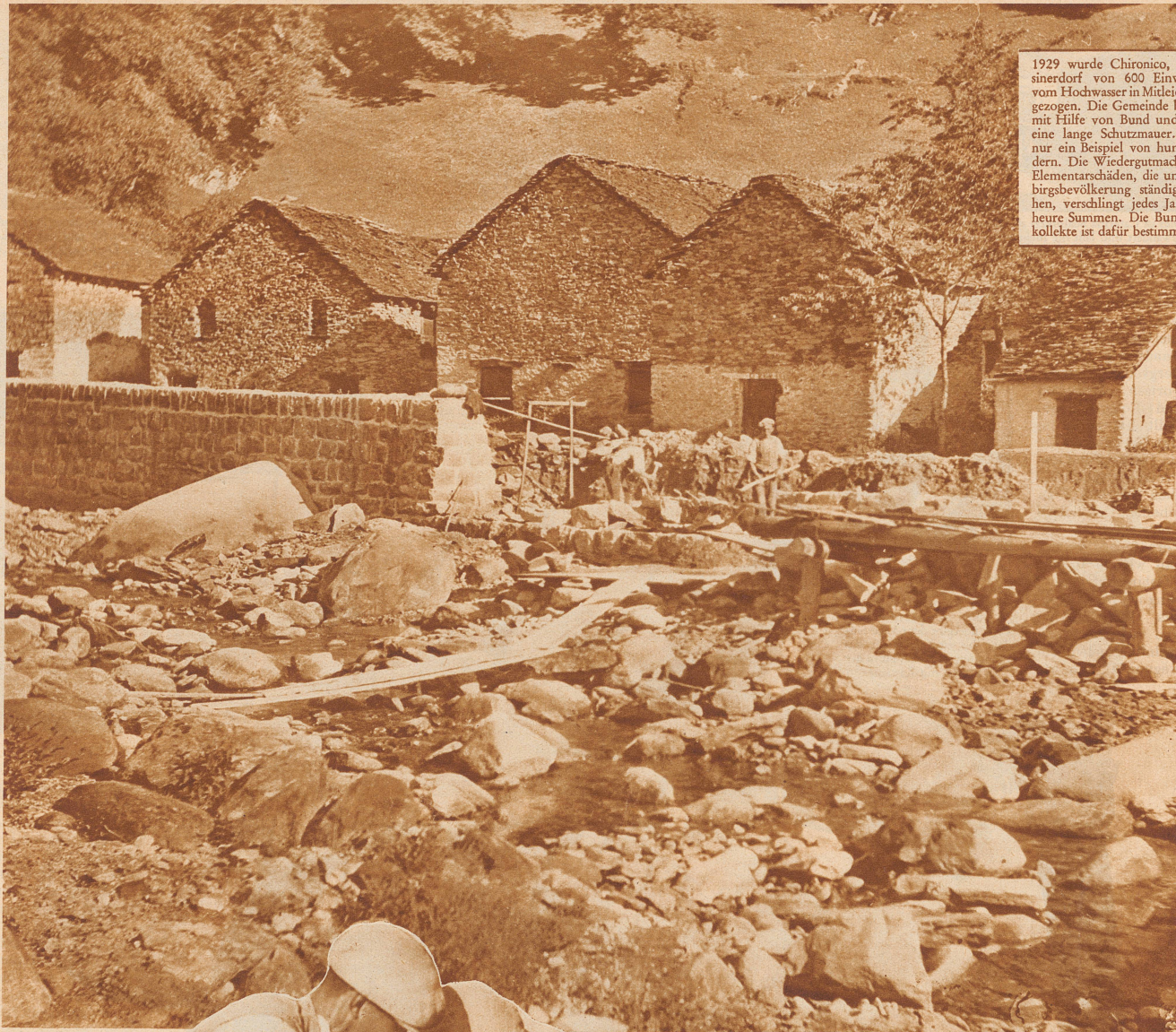
1929 wurde Chironico, ein Tesserndorf von 600 Einwohnern, vom Hochwasser in Mitleidenschaft gezogen. Die Gemeinde baut nun mit Hilfe von Bund und Kanton eine lange Schutzmauer. Das ist nur ein Beispiel von hundert andern. Die Wiedergutmachung der Elementarschäden, die unsere Gebirgsbevölkerung ständig bedrohen, verschlingt jedes Jahr ungeheure Summen. Die Bundesfeierkollekte ist dafür bestimmt