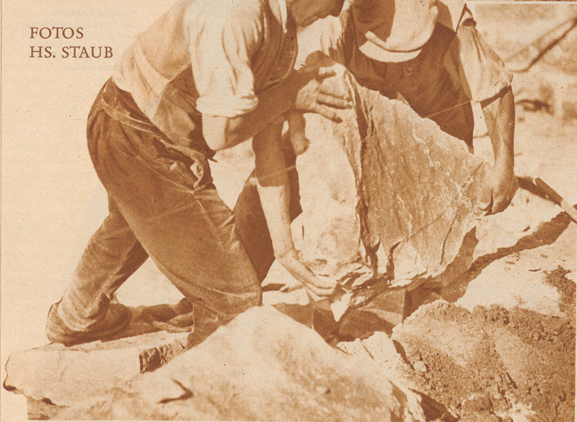
Die Verbauungen des Dorfbaches bringen Einheimischen willkommenen Verdienst. Die Blöcke für die Schutzmauer werden aus dem nahen Granitfels gesprengt. Häuser, Dächer, Umzäunungen, alles wird hier mit diesem Granit gebaut