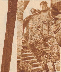
In den typischen Gebirgsbevölkerungsdörfern begegnet man auf Schritt und Tritt verfallenden und verlassenem Steinhäusern. In Santa Domenica im Calanca, z. B. kann man Häuser für 250 Franken kaufen. Zwei Drittel der Häuser dieser Dörfer sind heute nicht mehr bewohnt