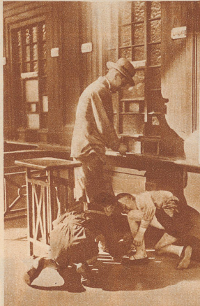
Zwei Freunde putzen an einem Schuh, — damit es möglichst schnell geht!