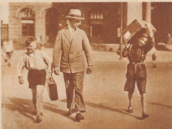
Koffertragen, — pro Stück 10 Pfennig!