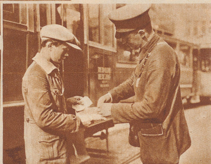
Das hier ist einer von den ganz Schlauen; den Tramkondukteuren wechselt er jeden Abend das viele Kleingeld ein und gibt es dann gegen ein kleines Entgelt an die Kellner weiter, die doch immer so viel «Münz» brauchen

stochern mit langen Stöcken in den Kellern und Rinnsteinen umher und finden manchmal noch etwas Brauchbares, das sie verkaufen können. Und dann gibt es noch ganz Schlaue: sie holen sich am Abend bei den Tramkondukteuren das viele Kleingeld und tauschen es ihnen gegen eine Banknote ein; das «Münz» aber bringen sie dann den Kellnern der Wirtschaften und Kaffeehäuser; die sind immer froh darum und geben ihren kleinen Helfern gerne dafür etwas ab.