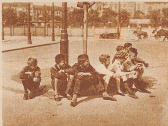
So sitzen die kleinen Geldverdiener viele Stunden lang und passen scharf auf, wo es etwas zu «fangen» gibt, — Arbeit und Verdienst

Wenn ich mir die kleinen tapferen Kerle so ansehe, — dann muß ich denken, wie recht das Sprichwort hat: «Not macht erfinderisch.» Was die deutschen Buben jetzt alles probieren! Daran hätten sie früher, wie es ihnen noch gut ging, bestimmt nicht gedacht. Sie warten auf den Bahnhöfen auf die großen Auslandszüge und dann stürzen sie flink herbei, tragen Koffer, putzen den Reisenden die Schuhe, zeigen ihnen den Weg ins Hotel; oder solche, die singen können, tun sich zusammen zu einem Trio oder einem Quartett, gehen in die Höfe und singen den Leuten etwas vor, bis von allen Seiten die Zehnpfennigstücke herunterfliegen. Andere