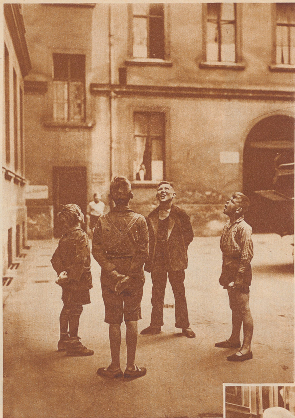
Eine neue Art, Geld zu verdienen: Vier Freunde tun sich zu einem Quartett zusammen und singen in den Höfen; der Erlös wird jeden Abend ehrlich geteilt