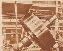
Einer von den drei Girokopten des «Conte di Savoia» bei der Montage. Der Kreislauf misst 5 Meter im Durchmesser und wiegt 100 Tonnen

von der italienischen Schiffahrtsgesellschaft Lloyd Sabaudo wird als erster Ozeandampfer mit einer Einrichtung versehen, die das Rollen, das Seitwärtschlagen des Schiffes, das durch den Wellengang verursacht wird und die Ursache alles Uebels ist, verhindert. Die Seekrankheit soll durch diesen Stabilisator ausgeschaltet werden. Diese Wandlerichtung, Girokopt genannt, ist ein rotierender Kreislauf von sehr großen Annahmen, im Bug des Schiffes, etwas unter der Wasserlinie, eingebaut. Der «Conte di Savoia» besitzt drei solcher Girokopte. Sie wiegen je hundert Tonnen und sind so angebracht, daß sie wohl in longitudinaler, nicht aber in transversaler Richtung (im Sinne des Schiffkörpers verstanden) beweglich sind. Die Girokopte funktionieren selbsttätig. In weiterer als einer Vertikallage nach Beginn des Rollens, das heißt bevor die menschlichen Sinne es wahrnehmen können, treten sie in Funktion und üben ihre vorbeugende Wirkung aus. Vorausgesetzt, daß Theorie und Praxis miteinander übereinstimmen, wenn grundsätzlich bis zum Beweise des Gegenteils nicht gewandelt werden darf, muß dieses Girokopt als eine wertvolle neue Erfindung für die Schiffahrt angesehen werden.