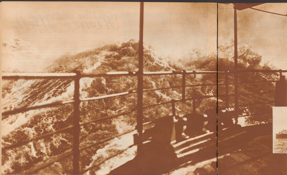
Im Nebel: Windstärke 12: Orkan. Aber ohne Dampf, ausgerüstet mit dem Girokopt, vermögen auch so mütige Wogen nicht ins Rollen zu bringen

von der italienischen Schiffahrtsgesellschaft Lloyd Sabaudo wird als erster Ozeandampfer mit einer Einrichtung versehen, die das Rollen, das Seitwärtschlagen des Schiffes, das durch den Wellengang verursacht wird und die Ursache alles Uebels ist, verhindert. Die Seekrankheit soll durch diesen Stabilisator ausgeschaltet werden. Diese Wandlerichtung, Girokopt genannt, ist ein rotierender Kreislauf von sehr großen Annahmen, im Bug des Schiffes, etwas unter der Wasserlinie, eingebaut. Der «Conte di Savoia» besitzt drei solcher Girokopte. Sie wiegen je hundert Tonnen und sind so angebracht, daß sie wohl in longitudinaler, nicht aber in transversaler Richtung (im Sinne des Schiffkörpers verstanden) beweglich sind. Die Girokopte funktionieren selbsttätig. In weiterer als einer Vertikallage nach Beginn des Rollens, das heißt bevor die menschlichen Sinne es wahrnehmen können, treten sie in Funktion und üben ihre vorbeugende Wirkung aus. Vorausgesetzt, daß Theorie und Praxis miteinander übereinstimmen, wenn grundsätzlich bis zum Beweise des Gegenteils nicht gewandelt werden darf, muß dieses Girokopt als eine wertvolle neue Erfindung für die Schiffahrt angesehen werden.