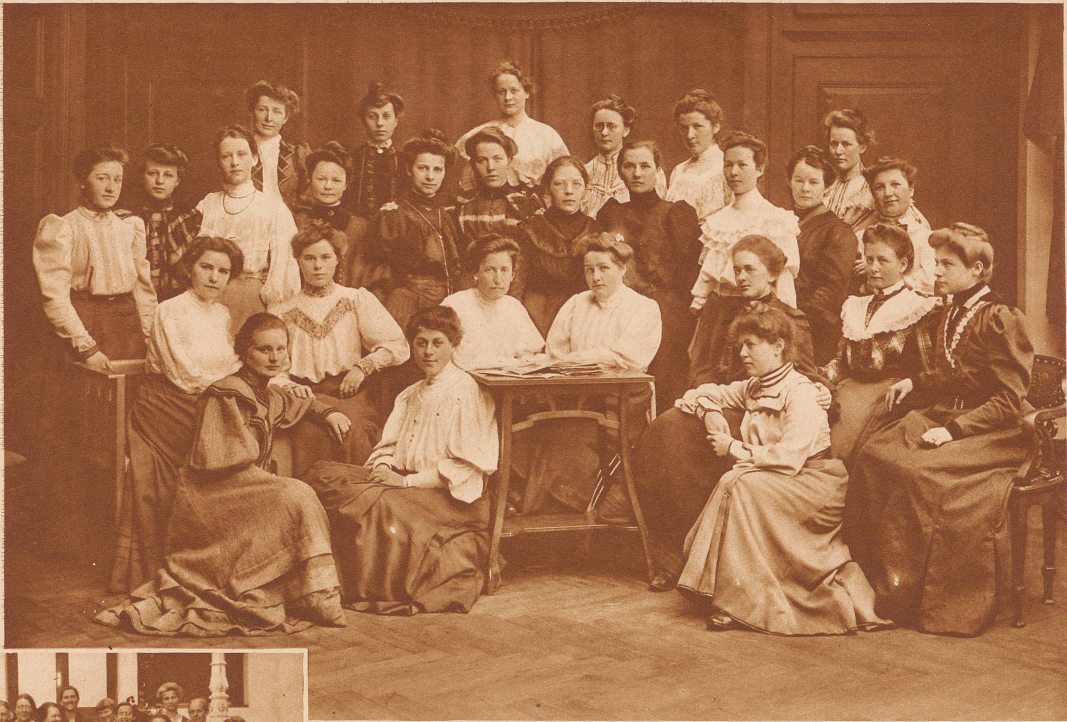
Früher alt — jetzt jung