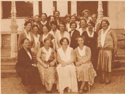
... und nach 25 Jahren

Welter irgend etwas nicht stimmt, steht für ihn fest. Wenn er sich nur ein einwandfreies Bild über die Beziehungen zwischen Nora und ihm machen könnte. Man sprach ja damals von einer Liebschaft, aber das konnte ebensogut Theater- und Kurhausklatsch sein. Nora selbst zu befragen, hat er bisher vermieden. Wozu auch! Welche Frau gibt so etwas unumwunden zu? Und darauf kam es auch gar nicht an. Nur darauf, ob Welters Neigung zu ihr noch immer so stark, so leidenschaftlich war, daß sie als Motiv zu dem Mord an Detring angesehen werden könnte.