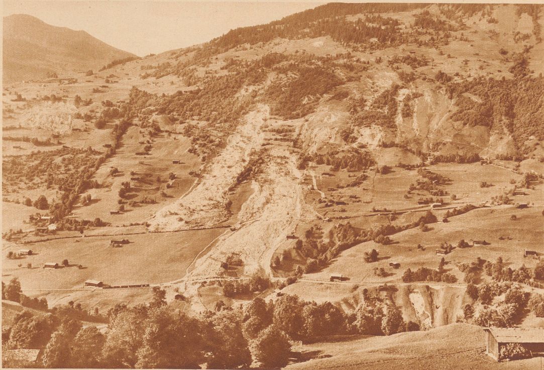
Der Ort Saas im Prätigau wurde von einer schweren Erdstürkatskatastrophe heimgesucht. Mehrere Ställe wurden zerstört, Bahn und Straße verschüttet und eine beträchtliche Fläche guten Kulturlandes von der gewaltigen Rufe vernichtet