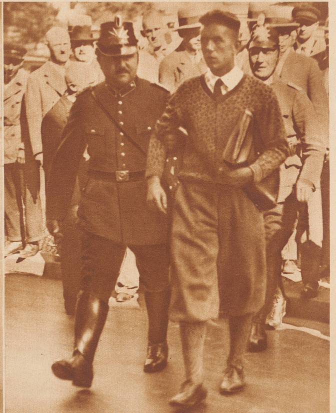
Bei den kommunistischen Tumulten vom 10. August am Bülowplatz wurden mehrere Polizei- und Zivilpersonen getötet. Ueber den Platz wurde der Belagerungszustand verhängt und alle Passanten nach Waffen durchsucht