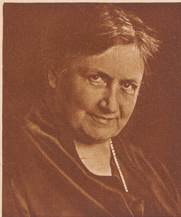
Frau Dr. Maria Montessori , der berühmten italienischen Ärztin, die ein neues geniales System der Kindererziehung ausgearbeitet hat, das bereits in sämtlichen Ländern Europas und vereinzelt schon in Indien und Japan mit großem Erfolg in eigens dafür errichteten Schulen angewendet wird. Der Hauptfortschritt ihres Systems gegenüber dem bisherigen besteht darin, daß die Kinder schon in ganz frühen Jahren als selbständige, freie Wesen behandelt werden, die alle Dinge durch eigene Erfahrung, nicht durch aufgezwungene Befehle kennenlernen sollen