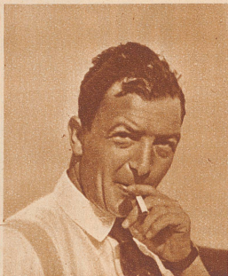
Alfred Comte , einer der ersten schweizerischen Flieger und erfolgreiche einheimische Flugzeugkonstrukteur