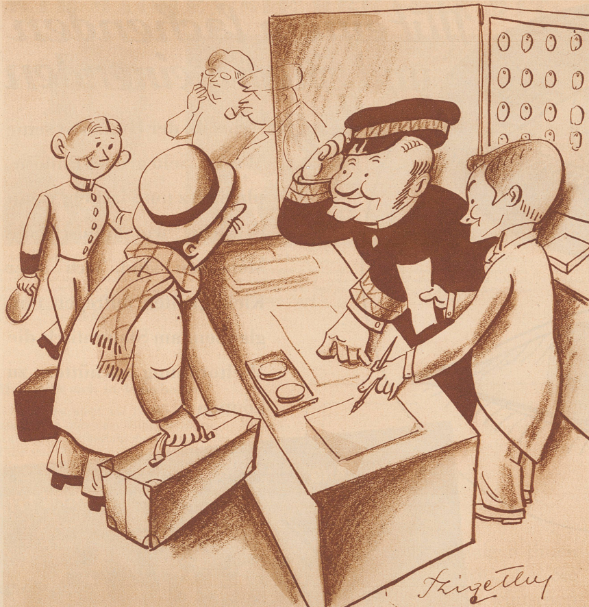
«Wollen Sie ein Zimmer mit fließendem Wasser?» «Wozu? Bin ich ein Hecht?!»