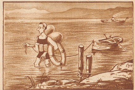
Herr Aengstlich geht baden