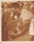
Links: Der Staat von Ungeheuren... (Text continues with a commentary on the event)