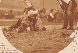
Die alten Wätschberg... (Text continues with a description of the event)