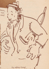
Es sollte Götli... (Text continues with a humorous or descriptive note)