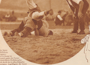
Lang jost das... (Text continues with a commentary on the wrestling match)