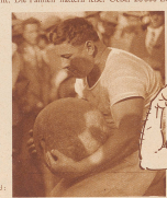
Links: Der Stab von Utopia... (Text continues with details about the event's organization)