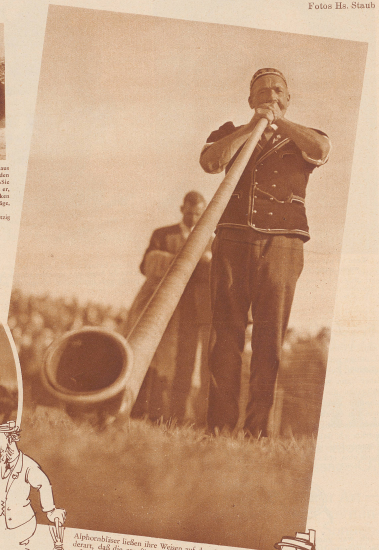
Alphornbläser locken ihre Wenner auf dem Festplatz entgegen, damit das die simplifizierte Gewinner des Sportplatzes vor sich im rühmigen Schwing- und Aepplerfest führen