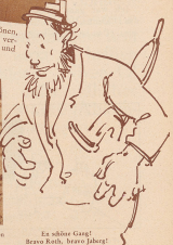
Es sollte Gung!... (Text continues with a humorous commentary on the match)