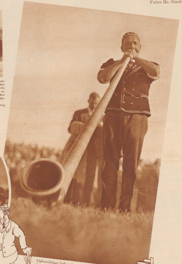
Alphornbläser locken ihre Wenner auf dem Festplatz entgegen, damit die simplifischen Gewinner des Sportplatzes vor sich im rühmigen Schwing- und Aelplerland führen können.