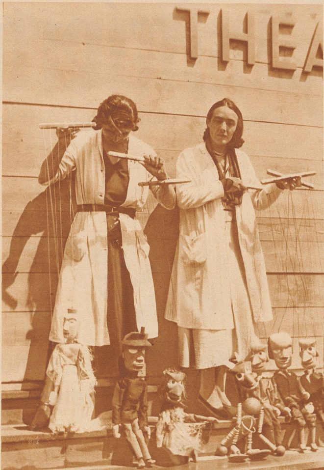
Die zwei Hauptfiguren: Der Soldat und die Prinzessin