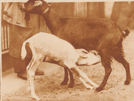
Junge Säbelantilope aus Marokko mit ihrer Amme, einer Beduinenziege