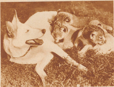
Weißer deutsche Schäferhündin als Amme von drei jungen Löwen