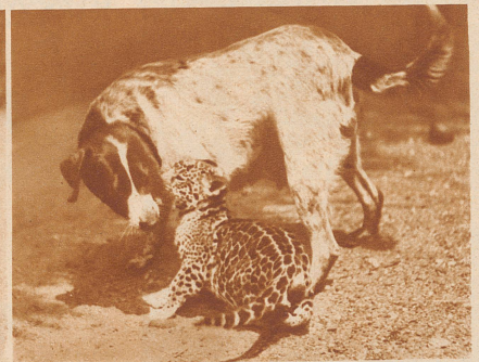
Junger Jaguar spielt mit seiner Ziehmutter, einer Hündin