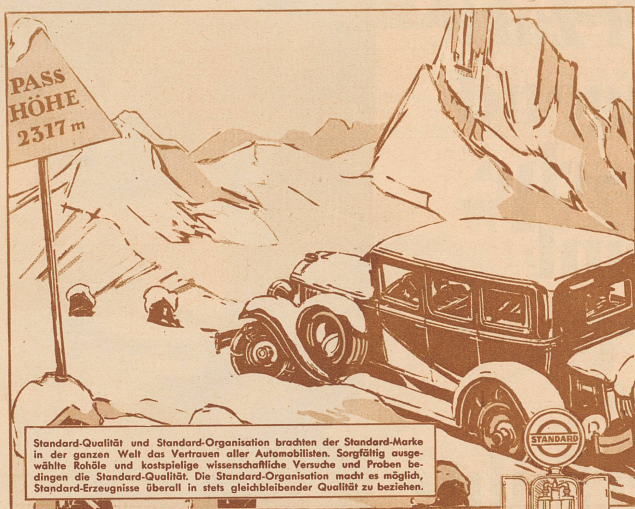
Standard-Qualität und Standard-Organisation brachten der Standard-Marke in der ganzen Welt das Vertrauen aller Automobilisten. Sorgfältig ausgewählte Rohöle und kostspielige wissenschaftliche Versuche und Proben bedingen die Standard-Qualität. Die Standard-Organisation macht es möglich, Standard-Erzeugnisse überall in stets gleichbleibender Qualität zu beziehen.

Oel wechseln Sie am besten, wenn der Motor noch warm ist. Zum Nachwaschen nach dem Entleeren nehmen Sie Standard Motor Oil light (dünnflüssig) — 2 Liter genügen — aber niemals Petroleum!