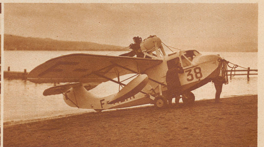
Das Amphibiumflugzeug auf dem festen Land. Die Schwimmer schweben in der Luft, auf festen Rädern wird die Maschine über den Boden gerollt

Die «Zürcher Illustrierte» erscheint Freitags • Schweizer Abonnementspreise: Vierteljährlich Fr. 3.40, halbjährlich Fr. 6.40, jährlich Fr. 12.-. Bei der Post 30 Cts. mehr. Postscheck-Konto für Abonnements: Zürich VIII 3790 • Auslands-Abonnementspreise: Beim Versand als Drucksache: Vierteljährlich Fr. 4.50 bzw. Fr. 5.25, halbjährlich Fr. 8.65 bzw. Fr. 10.20, jährlich Fr. 16.70 bzw. Fr. 19.80. In den Ländern des Weltpostvereins bei Bestellung am Postschalter etwas billiger. Insertionspreise: Die einspaltige Millimeterzeile Fr. -.60, fürs Ausland Fr. -.75; bei Platzvorschrift Fr. -.75, fürs Ausland Fr. 1.-. Schluß der Inseraten-Annahme: 14 Tage vor Erscheinen. Postscheck-Konto für Inserate: Zürich VIII 15769