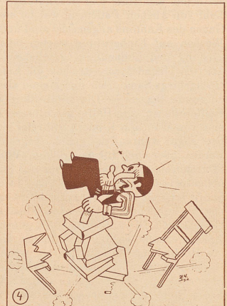
Da muß ihm auch das noch passieren! O weh! schreit Max. Alles nur wegen dem elenden Fliegengeschmeiß!