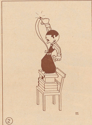
Fliegenfänger sind klebrige Dinger. Sie bleiben nicht nur an den Fliegen, sondern auch am Max kleben