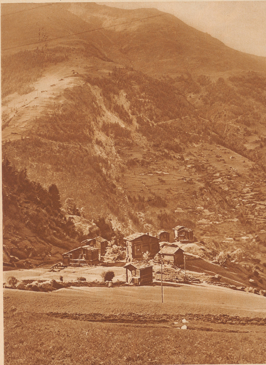
Blick auf Grächen, in der Mitte das Haus Thomas Platters, das er in seiner Lebensgeschichte beschrieb: