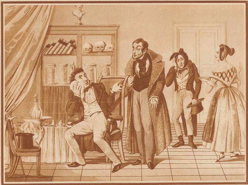
Je deutlicher allmählich der Stand des Zahnarztes, den es im Mittelalter noch nicht gab, in Erscheinung tritt, desto mehr wird er Gegenstand der Spottlust seiner unglücklichen Opfer. Am häufigsten ist der Vorwurf, den der Patient aus der Biedermeierzeit hier nach beendeter Operation erhebt: «Sie haben den unrechten Zahn erwischt»

Im Mittelalter, das soviel kostbares Gut aus dem Altertum verkommen und verwildern ließ, trat auch in der Zahnheilkunde eine große Stagnation ein. Wertvolle, mit Mühe eroberte Erkenntnisse wurden wieder vergessen und überließen ihren Platz dem Aberglauben der tollsten Art. Das Märchen von den zahnfressenden Würmern galt als feststehende Wahrheit, an die sogar tüchtige Aerzte glaubten. Die Fabel von den begnadeten Menschen mit dem «goldenen Zahn» ging von Mund zu Mund und gelehrte Männer schrieben dicke Bücher darüber.