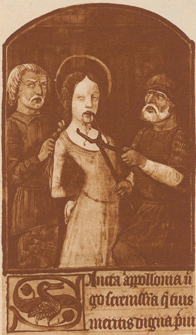
Die Heilige Apollonia wurde durch die Art ihres Martyriums zur Schutzpatronin aller Zahnwehkranken: weil sie sich weigerte, die alten Götter anzubeten, wurden ihr die Kiefer zertrümmert und die Zähne ausgeschlagen. (Darstellung ihres Martyriums nach einer Handschrift des 15. Jahrhunderts aus der Churfürstlichen Bibliothek in Mannheim)

errungen hatte und berühmte Köpfe zu den ihren zählte, fehlt von einer auch noch so bescheidenen «Zahnheilkunde» jede Nachricht; und mitfühlenderweise fragen wir uns, die wir die Höllenqualen kranker Zähne kennen: was machten eigentlich die vielen, die vor uns lebten, wenn sie des Nachts mit wütendem Zahnschmerz aufwachten?