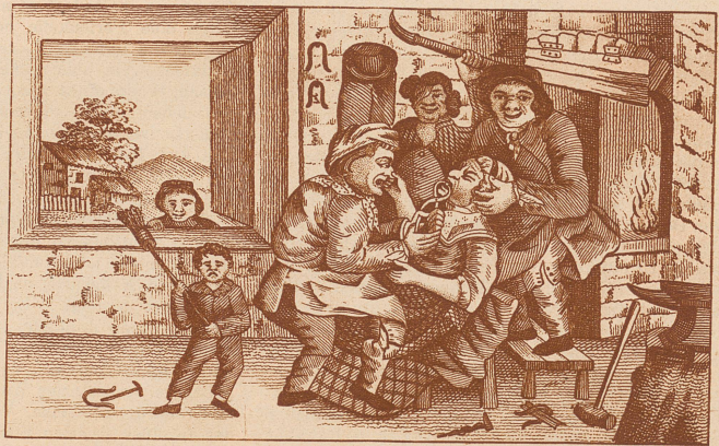
Sensation auf dem Dorf im 18. Jahrhundert: Der wandernde Heilgheilfe zieht unter Assistenz der ganzen Familie der Hausfrau einen wahrscheinlich schon längst fälligen Zahn. (Nach einem englischen Holzschnitt)