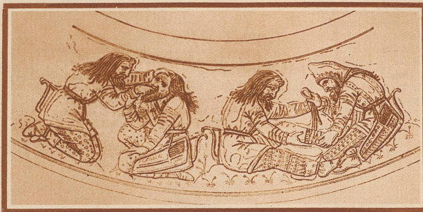
Älteste zahnärztliche Darstellung: Zwei Skythen, Arzt und Patient, in kniender Stellung. Der Arzt untersucht mit der rechten Hand den schmerzenden Zahn. (Griechisches Vasenbild aus dem 6. oder 5. Jahrhundert v. Chr.)

Kranke Zähne und Zahnschmerzen hat es zuverlässigerweise immer schon gegeben, denn die «gute alte Zeit», die wir uns so gern ausmalen, wo die Menschen noch naturnäher waren und jedermann ganze Zähne im Munde hatte, — ist ein Märchen. Wo es aber Schmerzen gibt, entsteht auch das Bestreben, sie zu lindern, zu heilen und ihnen vorzubeugen, und darum kann man sich gar nicht genug wundern, daß Jahrtausende vergehen mußten, bis die Zahnheilkunde (in allerjüngster Zeit) aus einem zufälligen Konglomerat von Einzelerfahrungen zu einer anerkannten, höchst erfolgreichen Wissenschaft wurde. In Zeiten, als die medizinische Wissenschaft schon ganz große Erfolge