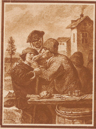
Der «Zehndausbrecher» bei der Arbeit auf dem Lande: Viel mehr als eine kräftige Faust und ein paar schmerzstillende Tinkturen braucht er für eine Zahnextraktion nicht. (Alter Stich aus dem Anfang des 17. Jahrhunderts nach einem Gemälde des Niederländers Adrien Brouwer)

Das Bildmaterial dieser Arbeit stammt aus der Medizinhistorischen Sammlung der Universität Zürich (Leiter Prof. Dr. Wehrl). Prof. Wehrlis großangelegte medizinische Ausstellung an der «Hyspa» erregte das besondere Interesse der Besucher