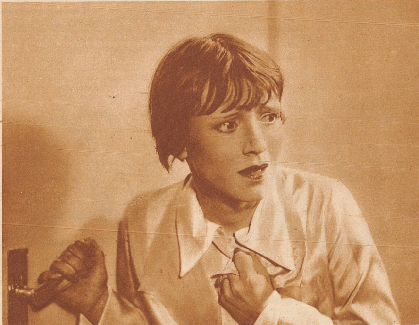
Die Novelle «Der Ball» ist unlängst verfilmt worden; Dolly Haas spielt die Rolle der halbwüchsigen Tochter

«Aber natürlich, reg dich nur nicht auf. Wo ist denn deine Liste? Wir haben doch noch all die Leute, die du voriges Jahr in Nizza, in Deauville, Chamonix kennengelernt hast...»