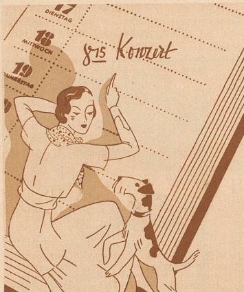
HAARWASCHE NACH DEM KALENDER! Gesundes Haar verlangt Regelmäßigkeit in der Pflege — genau wie das Gesicht. Also Haarwäschen 1 x pro Woche. Und inzwischen, sobald das Haar fettig wird, TROCKENSCHAUMPON — nur beuteln und bürsten. Gebrauchsfertig in der charakteristischen Achtckschachtel.

Er breitete geschickt und rasch eine Art Sturmhaube feinsten Membran über ihre Hände, so daß