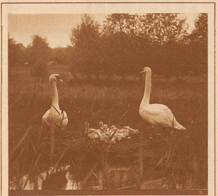
SCHWÄNE AM HALLWILER SEE

Wie diese Schwäne ihre Brut beschützen, so wachen kundige Hände über die Herstellung einer stets gu- ten Qualität der bekannten Hallwiler Forellen