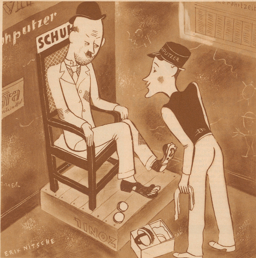
Was darf es sein für den Herrn? Schuhputzen? — Pedicure? — Schuhsohlen?