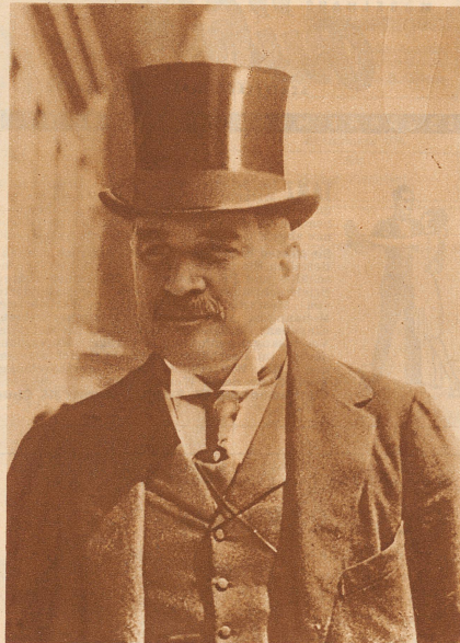
J. P. Morgan, der Jüngere, geboren 1868, seit dem Tode seines Vaters im Jahre 1913 Chef der Morganbank in New York. Als Vertreter von U. S. A. nahm er 1929 mit Owen Young an der Pariser Reparations-Konferenz teil

Als seinerzeit nach dem Bürgerkriege das durch eine Inflation entwertete Geld durch eine nachfolgende Geldverknappung (Deflation) wieder kaufkräftiger gemacht werden sollte, da wehrte sich Präsident Lincoln gegen diesen Plan. «Ein Staatsmann, der Schulden für sein Volk eingetht und durch eine Deflation die Kaufkraft dieser Schulden erhöhen läßt, bevor sie abbezahlt sind, der ist ein Verbrecher an seinem Volke», erklärte er damals. 1920 war kein Lincoln da, weder in den Vereinigten Staaten noch in Europa, der der damals geplanten Deflation Einhalt gebot. Sie wurde durchgeführt und die Last der Schulden ist, ohne Veränderung des Nennbetrages, bloß durch eine Erhöhung der Kaufkraft des Geldes, verdoppelt worden; den Vorteil hatten die Gläubiger, die ein leichtverdienendes, kaufkraftschwaches Geld einbezahlt hatten und nun ein Geld mit doppelt so großer Kaufkraft zurückerhielten. Nicht alle Staaten machten dabei ohne weiteres mit. So weigerte sich Frankreich