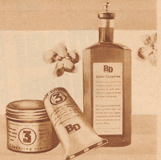
Lotion Camphrée kostet Fr. 2.75 die Flasche. (Spezialisieren: für normale oder für empfindliche Haut). Fettcrème Nr. 3 kostet Fr. 3.50 der Original-Topf - Fr. 2.25 die Tube

GENERAL-DEPOT FÜR DIE SCHWEIZ: PARFA A.-G., Mythenstraße 24, ZÜRICH