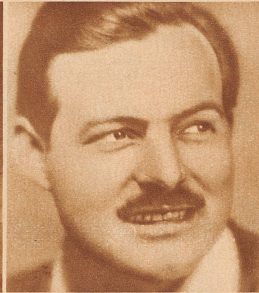
Ernest Hemingway, dem amerikanischen Schriftsteller, der auch in deutschsprachigen Ländern durch seine männlichen temperamentsvollen Romane und Novellen in dem letzten Jahr schnell bekannt wurde. Hemingway hat den Weltkrieg als amerikanischer Offizier an der italienischen Front mitgemacht. — Seine Hauptwerke (sämtlich im Verlag Rowohlt, Berlin, erschienen): «Fiesta», «Männer», «in einem anderen Land» (ein Kriegsroman, der kürzlich von Karl Zuckmayer dramatisiert und mit Erfolg aufgeführt wurde)