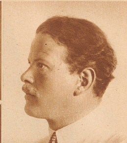
John Knittel, dem in Indien geborenen, in Basel erzogenen, durch die ganze Welt reisenden Schweizer Schriftsteller, der seine ersten Werke noch in englischer Sprache schrieb, seinen Haupterfolg aber in der Schweiz und in Deutschland erlangte. Knittel besitzt in Marokko eine Farm, auf der er Schafzucht betreibt, der er sich ebenso liebevoll widmet wie seinen Büchern. In dem Kolonialkampf steht er entschieden auf Seiten der Eingeborenen; seinem Freunde Abd-el-Krim hat er in dem Roman «Abd-el-Kader» ein Denkmal gesetzt. — Seine Werke sind sämtlich im Orell Füssli Verlag erschienen: «Die Reisen des Aaron West», «Der Weg durch die Nacht», «Thérèse Etienne», «Der blaue Basalt»

Wunsch ist, einmal den hohen Herren in Bern einen Besuch abzustatten und bei dieser Gelegenheit die vielgepriesenen Schönheiten der Alpen aufzusuchen. Ich werde nicht versäumen, auch in Eure Heimat zu kommen. Auch Ihre Majestät, die Königin, wird mich auf meiner Reise begleiten. Eure wiederholt geäußerte Bitte, auf Urlaub in den Kanton Glarus zurückzukehren, erfülle ich mit schwerem Herzen, aber um so lieber, als ich weiß, daß Ihr meiner Krone Treue bewahren werdet. Mein lieber Herr Oberst, auf Wiedersehen in der Schweiz!»