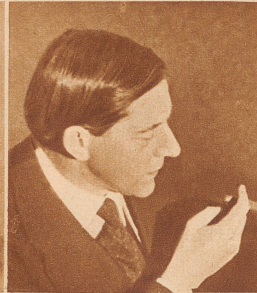
Waldemar Bonsels, der vielen von uns durch sein Buch «Die Biene Maja» ein schönes Jugenderlebnis vermittelt hat; «Die Biene Maja» wurde in sämtliche europäische und viele andere Sprachen übersetzt und macht sogar den japanischen und indischen Kindern Freude. — Seine weiteren Werke haben ihm auch bei den Erwachsenen einen großen Leserkreis geschaffen: «Eros und die Vagabunden», «Warralus», «Das Anjeki», «Himmelvolk», «Indienfahrt», «Mario und die Tiere»