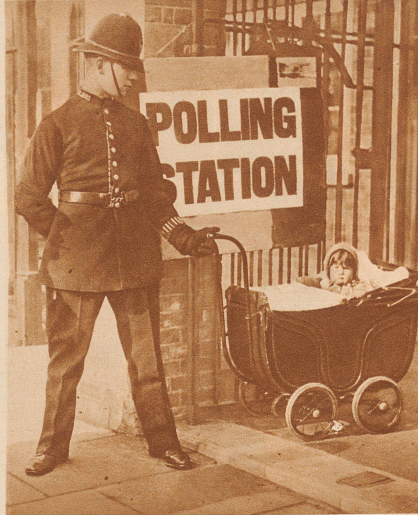
Vor einem englischen Wahllokal. Ein Anblick, wie ihn die schweizerischen Nationalratswahlen vorläufig nicht zu bieten vermögen. Die Mutter hat Stimmrecht, sie erfüllt im Wahllokal ihre wasserländische Pflicht, der liebenswürdige Londoner Polizeibeamte vertritt sie beim Kinderwagen