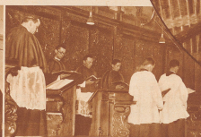
Die Augustiner-Mönche bei der Vesper in der Klosterkapelle

den Refugien. Das sind 2 kleine Hütten, die auf der Strecke zum Hospiz an erhöhten Punkten so gebaut sind, daß sie nie eingeschneit werden können. Hierher retten sich Reisende, die vom Unwetter überflutet werden. Die Zaffelschichten enthalten Telemorverbindung ins Tal und zum Hospiz, Ofen und Brennholz, Tisch und Bank, eine Decke, einen Schrank mit Proviant und Apotheke.