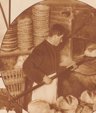
Das Hospiz besitzt eine eigene Bäckerei. Die Verproviantierung mit dem nötigen Mehl erfolgt in den Sommermonaten. Im Winter ist die Warenzufuhr ganz unmöglich

Trotz des Sturmes wurden die Hände täglich zweimal in den Schnee hinausgestrichen, damit sie in ständiger Gewöhnung des Unwetters blieben. Beim Mittagessen, zu dem uns der