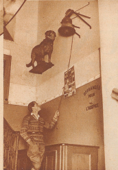
Hier im Vorbau des Hauptgebüdes des Hospiz stehen im Wind nicht ausgespült der berühmte (Berry), der 30 Menschen das Leben rettete, und kein von einem Tauchern erbeutet wurde, der im Irminschiff für einen Wolf hielt