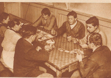
An den langen Winterabenden vertreiben Knechte, Mägde und Gäste die Zeit mit Kartenspielen