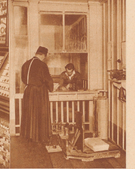
Das Postbüro - Hospiz Großes St. Bernhard, gewöhnlich verwaltet von einem Augustiner-Pater