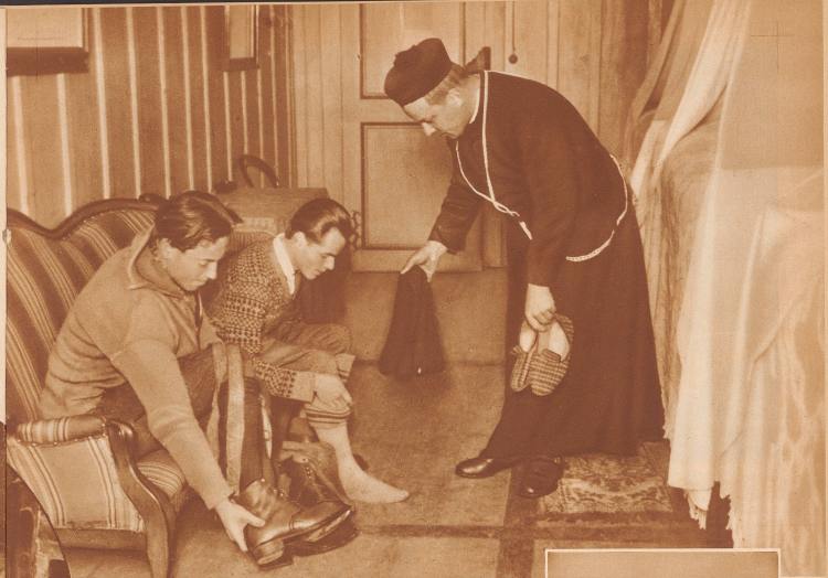
Im Hospiz werden die fremden Gäste vom Prior gastfreundlich mit der traditionellen Gabe, einem Paar warmer Hausschuhe, empfangen. Das ist fast so, als käme man zur Mutter nach Hause

Den Prior und die Knechte fragten wir täglich wohl zehnmal, ob er nicht denke, daß das Wetter besser werde. Wir truben uns im Kloster herum, spielten mit den Händen, langerten in den Polster- sesseln des Salons, klappten auf dem Klavier und suchten im Gästebuch nach berühmten Namen.