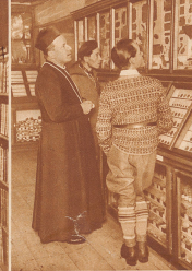
Das Museum, das besonders reich an römischen Altertümern ist