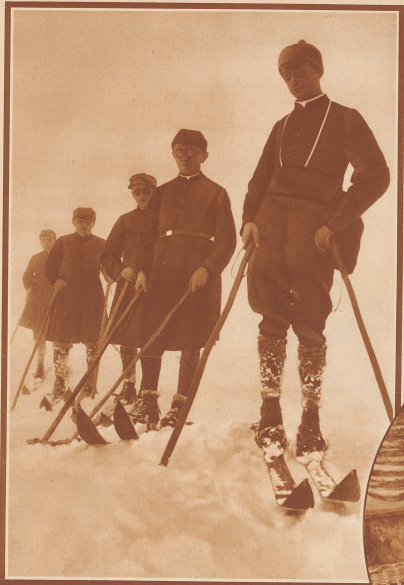
Die Mönche auf dem Gröden St. Bernhard sind als ausgezeichnete Skiläufer. Nicht aus lauter Lust am Sport, sondern mehr noch aus Notwendigkeit

den Winter gebauten Eingang direkt den 1. Stock des Hospiz, da das Felsgehäuse vollkommen zugeschnitten war. In der Vorhalle schallten wir unsere Skier ab, der Mönch, der mich begleitet hatte, zog an einem Glockenstrang, worauf der Prior erschien und mir ein Zimmer zuwies. Er brachte mir trockene Strümpfe und warme Pantoffeln, ließ einen heißen Kaffee bringen und wünschte angenehme Ruhe. Erwidert von dem über 6 Stunden dauernden Anstieg schloß ich fest und gut bis zum Morgen.