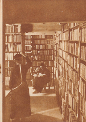
Die Bibliothek des Klosters enthält mehr als 20000 Bände aus allen Wissensgebieten