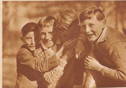
... ihre Mappe beim Erzmann wieder abholen, nicht ohne ihm zum Dank für seine Dienste die kalte Backe zu streicheln!