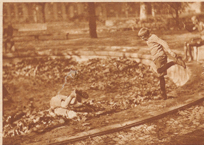
Nachher sind sie frei und ledig, spielen Fangis auf der Wiese, bis sie gehen müssen und ...