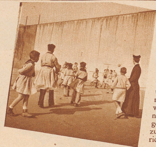
Beim Pelota-Spiel während der Pause, unter Aufsicht des dienstrunden Paters. Das Pelota-Spiel, ursprünglich Nationalspiel der Basken, wird mit einem kleinen, steinharten Ball gegen eine hohe, extra zu diesem Zweck errichtete Mauer gespielt

Der jungen spanischen Republik wird der Kulturkampf, den mit aller Energie zu führen sie entschlossen ist, noch viel Kummer bereiten, denn es ist kein Zweifel, daß ein nicht zu übersehender Teil des spanischen Volkes sich durch die neuen antikirchlichen Gesetze beleidigt und übergangen fühlt und die Entblößung der Kirche von aller Machtvollkommenheit, — die eben der moderne Staat restlos für sich beansprucht, — nicht guthießt. Der erste Präsident der spanischen Republik, Alcalá Zamora, ist vor kurzem in diesem Kirchenkampf unterlegen und freiwillig zurückgetreten, ebenso der Innenminister Miguel Maura; sämtliche katholischen Minderheiten im Parlament, die Vasconavarren (Vertreter der katholisch-klerikalen Nordprovinzen), die Agrarier und die unabhängigen Katholiken haben nach An-