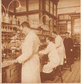
Im chemischen Laboratorium von La Sarrà. Hier werden nicht nur künftige Chemiker ausgebildet, sondern es dient auch zur wissenschaftlichen Forschungsstätte für fertige Chemiker