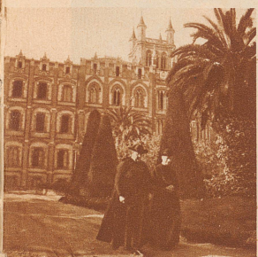
Das Gesamtgebäude des Kollegiums von La Sarrá mit dem prachtvollen Palmengarten

sonders gefährlich angesehen, weil sie es nicht verschmähen, von dem modernen Geist und der modernen Wissenschaft, deren letzte Auswirkungen sie mit allen Mitteln bekämpften, alles Gute und Wertvolle anzunehmen und ihren Zwecken anzupassen. Ihr berühmter Leitsatz: « Si finis licita est, media sunt licita », «Wenn der Zweck erlaubt ist, sind auch die Mittel erlaubt», boshaft über-