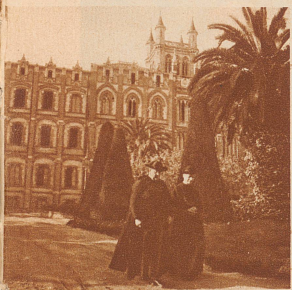
Das Gesamtgebäude des Kollegiums von La Sarrá mit dem prachtvollen Palmengarten

sonders gefährlich angesehen, weil sie es nicht verschmähen, von dem modernen Geist und der modernen Wissenschaft, deren letzte Auswirkungen sie mit allen Mitteln bekämpften, alles Gute und Wertvolle anzunehmen und ihren Zwecken anzupassen. Ihr berühmter Leitsatz: «Si finis licita est, media sunt licita» , «Wenn der Zweck erlaubt ist, sind auch die Mittel erlaubt», boshaft über-