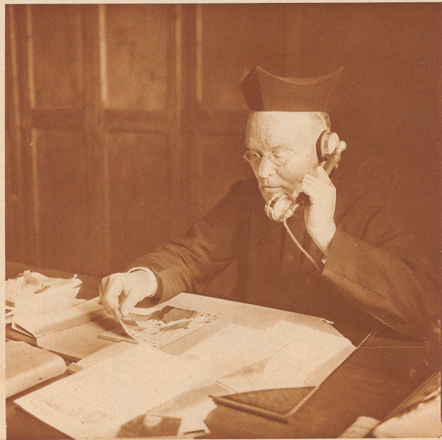
Der Leiter der Primarschule und des Internats. In dieser Abteilung bekommen die Kinder von sieben bis fünfzehn Jahren ihren ersten Unterricht

Fast vier Jahrhunderte hat die von dem Spanier Ignazio de Loyola gegründete Compañia Jesu in ihrem Mutterlande einen gar nicht zu ermessenden Einfluß ausgeübt, hat das Denken und die Bildung eines großen Teiles des spanischen Volkes geformt. Denn im Gegensatz zu der offiziellen Kirche, die nach ihrer großen Blütezeit im 16. und 17. Jahrhundert machthungrig, bildungsfeindlich und unduldsam wurde und sich restlos mit dem Monarchismus identifizierte, verkörperten die Jesuiten das Prinzip der Bildung, der «Macht durch Wissen», der Volkserziehung. In ihren unzähligen Kollegien und Instituten haben sie alle Alterstufen in allen Bildungsgraden unterrichtet, angefangen von der Primarschulbildung bis zu den höchsten wissenschaftlichen Spezialstudien und Forschungen; nie haben die Priester der Gesellschaft Jesu das ursprüngliche