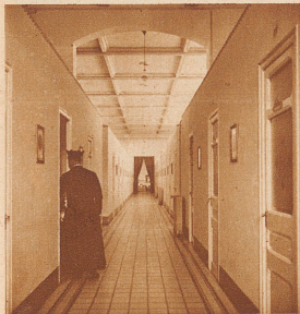
Ein Korridor aus dem Schüler-Internat: blitzsauber und weißgekachelte wie in einem Spital

ist bezeichnend, daß ihre Ausweisung jedesmal mit den kurzen demokratischen Revolutionen und Revolten zusammenfiel, die Spanien vor der jetzigen großen Umwälzung bereits hinter sich hatte: 1767, 1835 und 1868. Diesmal ist die Erschütterung so tief gewesen wie noch nie und die Republik zeigt den festen Willen, die Wege von Kirche und Staat endgültig zu trennen. Am unbeugsamsten geht sie dabei gegen den Jesuitenorden vor, in dessen Händen bis jetzt ein großer Teil der Erziehung der spanischen Jugend lag. (In einer offiziellen Statistik wurde im Jahre 1925 errechnet, daß 50% der Kinder keinen Unterricht genossen, 25% in staatlichen Schulen und 25% in kirchlichen Institutionen erzogen wurden; von letzteren entfällt gut die Hälfte auf die Jesuiten.) Die Jesuiten, diese Hüter der Reaktion in der ganzen Welt, werden im neuen Spanien als be-