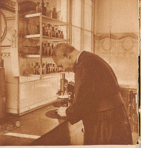
In dem Privatlaboratorium des leitenden Paters der wissenschaftlichen Abteilung. Eine ganze Reihe chemisch-biologischer Untersuchungen ist in den letzten Jahren aus dem Jesuiten-kloster in die Welt hinausgegangen