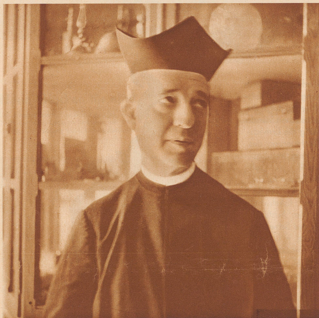
Der Leiter der wissenschaftlichen Abteilung der großen Erziehungs- und biologischen Forschungsanstalt von La Sarrà bei Barcelona

Anfang Oktober haben die spanischen Cortes ein Gesetz angenommen, wonach alle religiösen Orden aufzulösen seien, deren Regeln außer den drei kanonischen Gelübden der Armut, Keuschheit und des Gehorsams noch das vierte, nämlich dasjenige des Gehorsams gegenüber dem Papst enthielten. Diese Bestimmung richtet sich eindeutig gegen den Jesuiten-Orden, der damit als aufgelöst betrachtet werden muß.