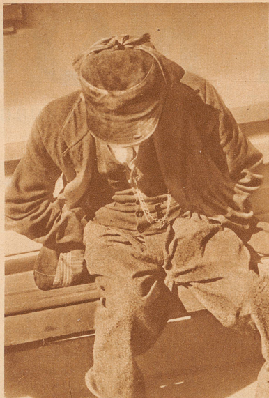
Am Sonntagnachmittag. Das Düttenkleben hört für einen Tag auf