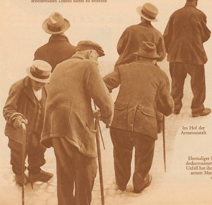
Im Hof der Armenanstalt