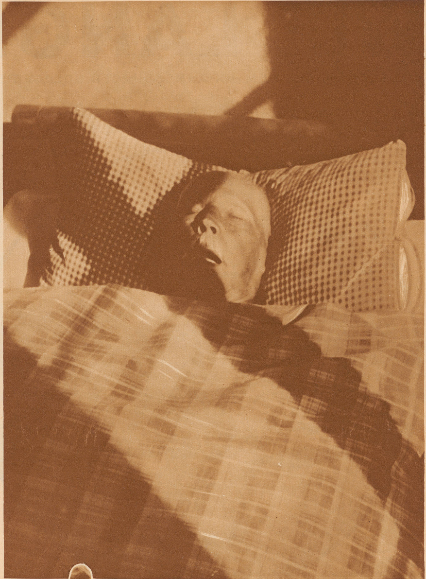
Einsamer Alter! Die Nachmittagssonne scheint in sein Zimmer. Er schläft