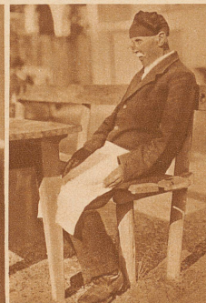
Ein 83jähriger Schneider wärmt sich in der Herbstsonne