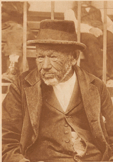
Er war viel an Wind und Wetter. Es ist hart, am Ende eines arbeitsreichen Lebens nichts zu besitzen