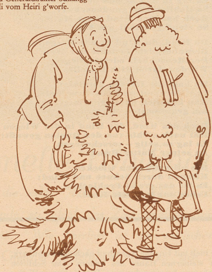
4. Underesse fangt d'Kathri ihrsrüts Verchafsverhandlige na! «Z'tüür?» Mi Seel nüd! — S'Bäumli .....