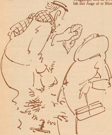
3. Hängüsi! S'hät Sie g'chrazet!! F'chli Harz isch am Näsli. Sell is ewäg butze?? Mir em rote Nastuech!