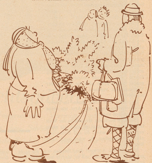
5. Bäumli wo bischt!!!! Bäumli was bescht!!