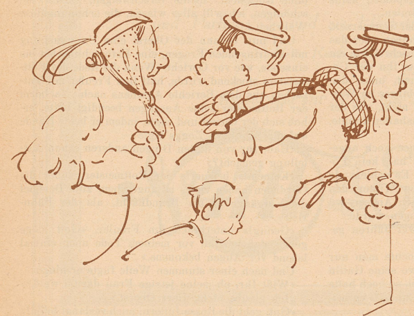
6. S'Bäumli hät güööchnet. Holer's! Heber's!