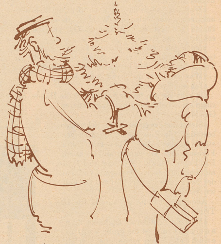
2. Eisitig meint sie se! «Eisitig? Kei Spur,» seit de Heiri und drehet s'Bäumli wie ne Riitschuel ume. — «Au!»