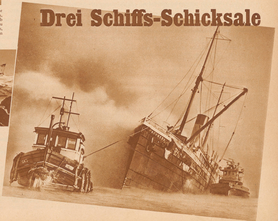
Bild rechts: Der amerikanische Frachtdampfer «Alameda», der seit 1908 zwischen Seattle und Alaska kursierte, geriet im Heimathafen Seattle in Brand. Löscharbeiten waren zwecklos und so wurde die «Alameda» in die offene See hinausgeschleppt und dort ihrem Schicksal überlassen. Der Wert des Schiffes wird auf 5 Millionen Schweizerfranken geschätzt