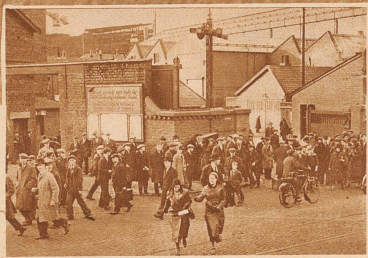
Zehn, zwanzig, dreißig Jahre lang schon arbeiteten manche Leute bei Messr. Brown, den Schiffbauern von Clydebank, wo der neue Cunard-Dampfer gebaut wird. — Es gab traurige Szenen, als die 3000 Mann, die mit dem Schiffsbau beschäftigt waren, am Samstag ihre Arbeitsstätte verließen, zu der sie am Montag nicht sollten zurückkehren können — arbeitslos!