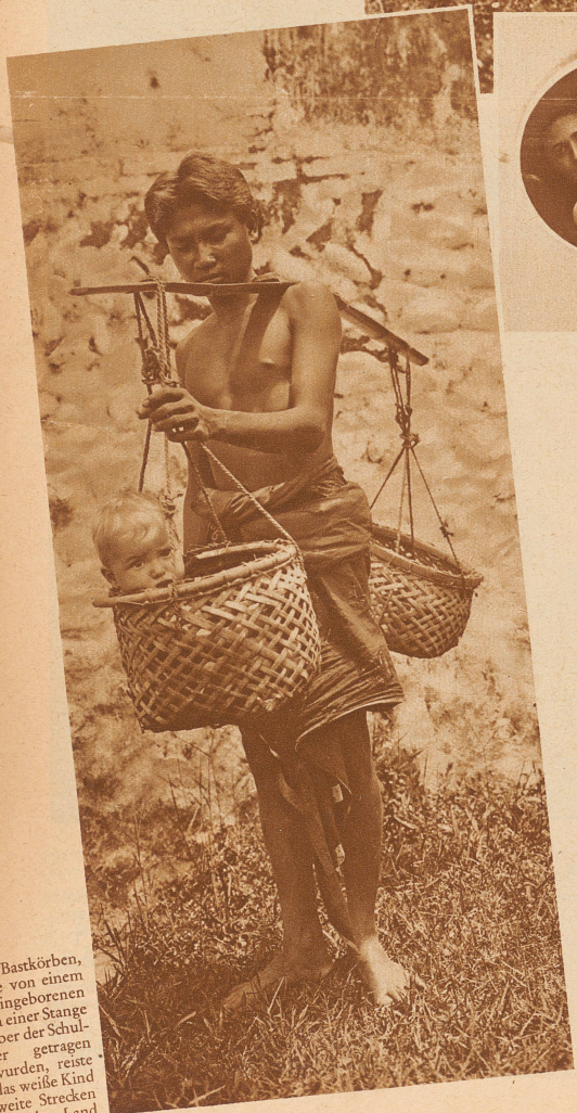
In Bastkörben, die von einem Eingeborenen an einer Stange über der Schulter getragen wurden, reiste das weiße Kind weite Strecken über Land