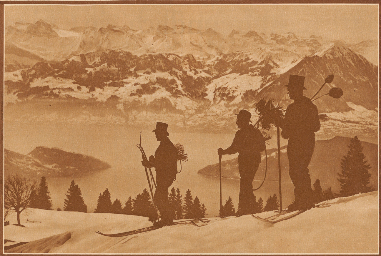
Ein glückliches 1932 wünschen allen unsern Lesern und Leserinnen der Verlag und die Redaktion der «Zürcher Illustrierten»