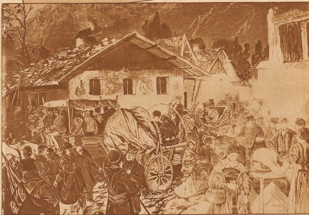
Nach 10jähriger Pause haben die Passionsspiele in Oberammergau wieder begonnen. Reisende aus aller Welt sind in großer Zahl eingetroffen