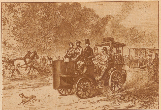
Eine Probefahrt der neuen Dampf-Autoschlangen auf der Charlottenburger-Chaussee bei Berlin

An dieser Sache hat sich wenig geändert. Menschen aus allen Weltteilen kommen auch heute zu diesen Aufführungen nach Oberammergau, nur daß die langsamen unbequemen Planwagen durch schnelle Automobile und luxuriöse «Cars alpins» verdrängt worden sind