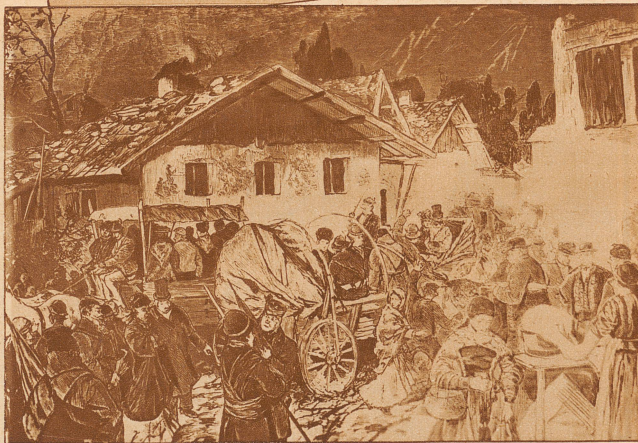
Nach 10jähriger Pause haben die Passionsspiele in Oberammergau wieder begonnen. Reisende aus aller Welt sind in großer Zahl eingetroffen