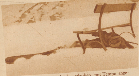
. . . sofern sie ein «unten durch» erlauben, mit Tempo angegangen, beides Uebungen, die ein tüchtiger Skiparouilleur aus dem ff beherrschen muß