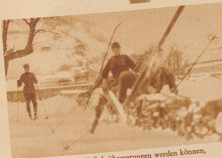
Hindernisse, die nicht einfach übersprungen werden können, werden durch Rücküberschlag genommen, oder . . .