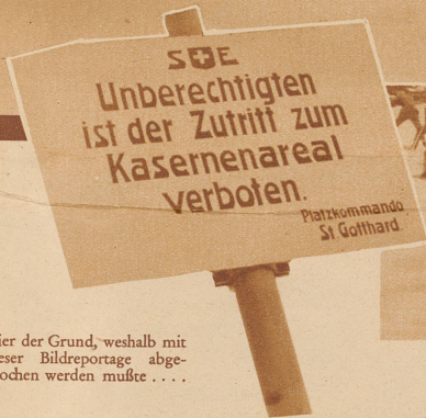
Hier der Grund, weshalb mit dieser Bildreportage abgebrochen werden mußte . . .