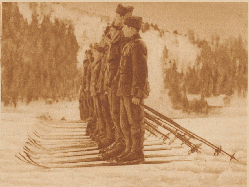
Ski parallel gestellt, Stöcke nach hinten. In dieser Stellung wird dem Klassenlehrer die Abteilung zum Dienst gemeldet