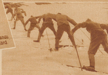
Im Grätschritt bergauf

Vom 26. Dezember 1931 bis 3. Januar 1932 war Andermatt Wintergarnison. 500 Unteroffiziere und Soldaten aus verschiedenen Einheiten der 3., 4. und 5. Division und der Gotthardbesatzung absolvierten im Urserental ihren Skikurs.