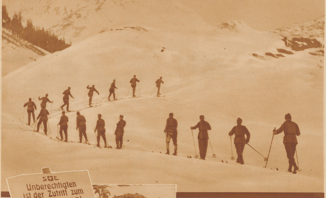
In Einerkolonne geht es hinaus in das weite Gelände, wo die verschiedenen Gangarten und Läufe ausgiebig geübt werden