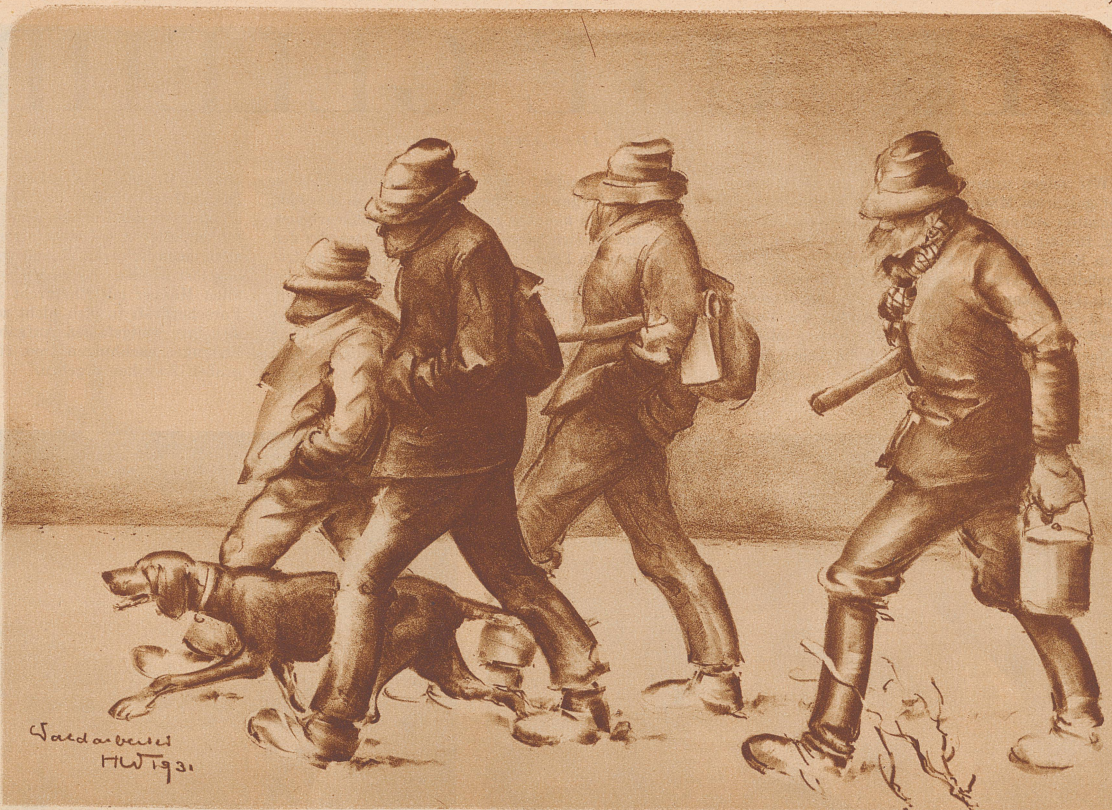
Waldarbeiter Lithographie von Hans Witzig