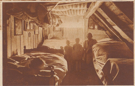
Bei den Heimwebern im Frankenwald. Schlafräum ist die Boden-kammer. In jedem Bett drei, vier Menschen. Durch das morsche Dach dringt Wind, Schnee und Regen herein. - In dieser Gegend schrieb ein Schulkind zu dem Aufsatzthema «Mein größter Wunsch»: «Wenn ich mir wünschen könnte, würde ich mir mal ein Bett kaufen und jede Nacht ganz allein darin schlafen»

stellern betrachten, er wollte das Bild des «Deutschland von unten» erkennen und festhalten. So wanderte und reiste er im Elendssommer 1930 kreuz und quer durch viele Teile Deutschlands; überall dort, wo gearbeitet und gehungert, gestempelt und gehungert wurde. Er war bei den Handwebern, Holzflößern