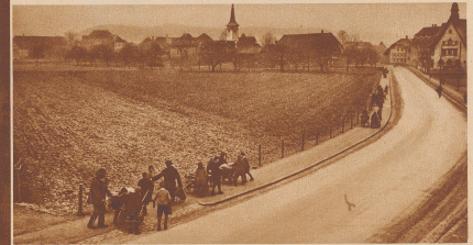
Unterwegs zwischen der alten und der neuen Schule. Das «Zügle» macht Spaß; jeder greift zu, um die Schätze der Klassenzimmer in den neuen Bus hantelbar zu machen