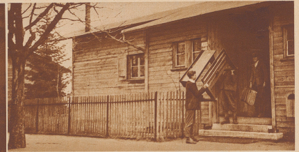
Es war gemütvor die alte Schulbarde; im Winter froh die Tüte auf dem Pulk zu führen bis, im Sommer schmeckt man selbst bei 35 Grad Hitze

VERLAG UND REDAKTION DER «ZÜRCHER ILLUSTRIERTEN»