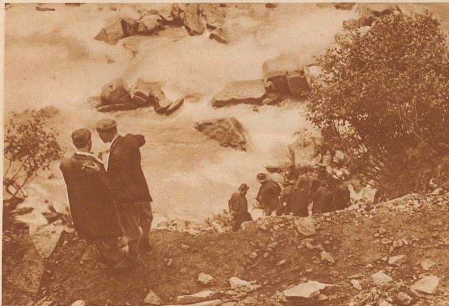
Prozeß Halsmann. Lokaltermin an der Absturzstelle. Der Herr rechts mit der Trauerbinde um den Arm ist der Angeklagte Halsmann

auf übergroßer Einbildungskraft, die zum Schluß an ihre eigenen Erfindungen glaubt. Auch die Revision des Prozesses brachte, entgegen dem Wunsch der gesamten Öffentlichkeit, keinen Freispruch, sondern Bestätigung des Urteils. Auch hier wieder ein Fall, wo der Indizienbeweis und der Beweis durch Zeugenaussagen vollkommen versagte. Die wirkliche Wahrheit war nicht zu ergründen, nur zu erfüllen. Wo aber blieb der Satz: «In dubio pro reo» (Im Zweifelsfall für den Angeklagten)?