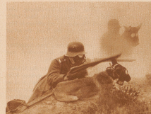
Der nächste Krieg — wenn die Menschen es dazu kommen lassen — wird zum großen Teil ein chemischer Krieg sein, da in kein Staat, der mehr oder weniger heimlich oder offen über seine eigene Methode, ohne Frieden zu verhandeln, mehr gemacht haben. Deutsche Soldaten und Soldaten bei einem Versteckungsgraben.