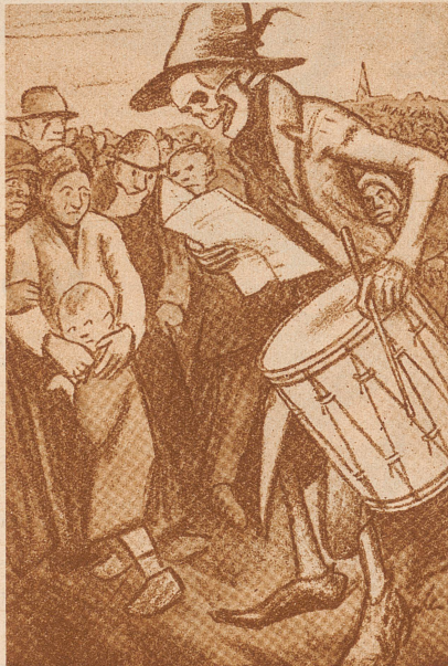
Mobilmachung im Zukunftskrieg

Es müßte in jedem Haus schon in Friedenszeiten ein gasdichter Raum vorhanden sein, der betoniert ist und die Frischluft durch elektromotorische Kraft zugeführt erhält. Es müßte Vorsorge getroffen werden, daß genügend Elektrizität vorhanden ist, auch wenn die ganze Bevölkerung Tage, selbst Wochen in diesen Räumen bleiben müßte. (Die Schwaden des Senfgases z. B. vergiften ein Gebiet für mehrere Wochen.) Hierzu genügt die Feststellung, daß in