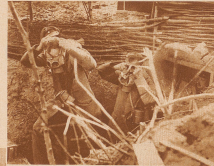
Der nächste Krieg — wenn die Menschen es dazu kommen lassen — wird zum großen Teil ein chemischer Krieg sein, da in kein Staat, der mehr oder weniger heimlich oder offen über seine eigene Methode, ohne Frieden zu verhandeln, mehr gemacht haben. Deutsche Soldaten und Soldaten bei einem Versteckungsgraben.