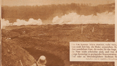
Das Gas kommt. Schon deutlich, nicht wahr, daß was auch Zerkleinern, die Mähdreschmaschine, Es gibt bei unauflöser Gase, die weder für die Augen noch in Nase nicht erkennbar sind, und von denen einige Atomgröße genügend Konzentration vom Tod oder im Besonderen Schicksal führen.