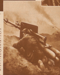
Größer Gaswerfer zum Gasabgeben? Zwei Soldaten können sie, die auf feindliche Linien montiert ist, die werden Soldaten gegen Soldaten, Soldaten gegen Soldaten, Soldaten gegen Soldaten. Keine Gasmaske schütz auf die Distanz von Gasen in so konzentrierten Form. Ein Windstoß aus der entgegengesetzten Richtung, und die Luft, oben, wo die Mähdreschmaschine nicht warnt, und das Gas wendet sich gegen den, der es wehrt. Im Weltkrieg oft vorkommend.