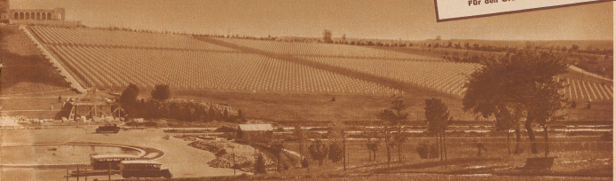
Amerikanischer Kriegfriedhof in Romagne sous Montfaucon in den Argonnen. — Groß, aber nicht der größte!