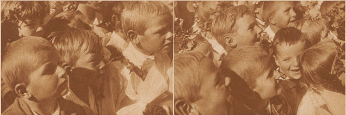
Für eure Kinder, nicht wahr, ihr Väter und Mütter, tut ihr alles, was in euren Kräften steht?