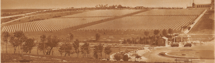
Was tut ihr aber, um sie vor solchem Schicksal zu bewahren?