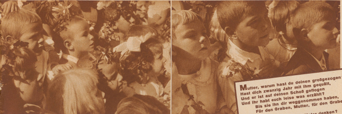
Aufnahmen von einem Kinderfest in Zürich von E. Mettler