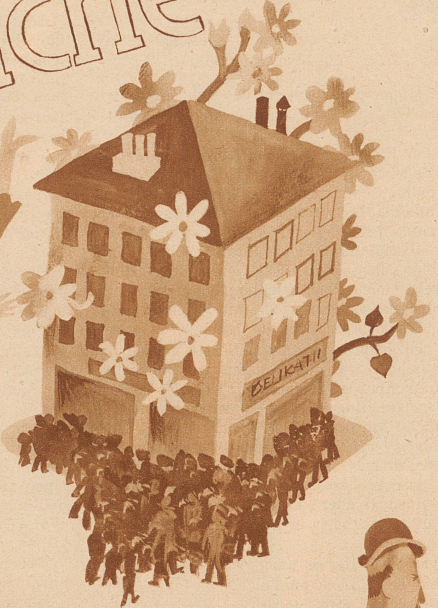
das Geschäft blüht