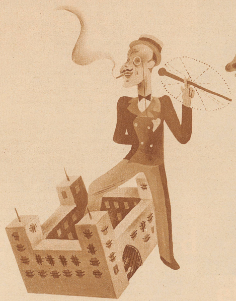
mit einem Bein im Zuchthaus stecken