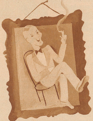
im Bilde sein