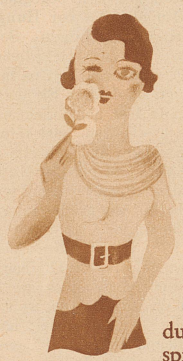
durch die Blume sprechen