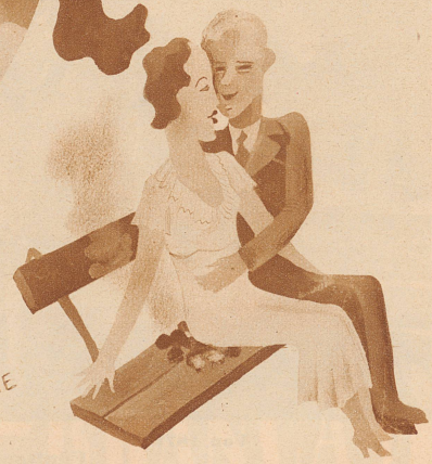
auf Kohlen sitzen