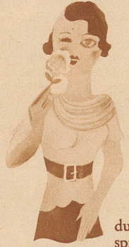
durch die Blume sprechen