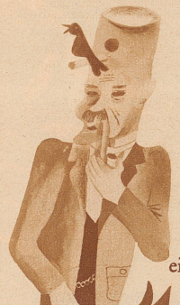
einen Vogel haben