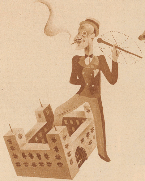
mit einem Bein im Zuchthaus stecken