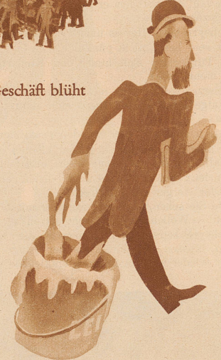
aus dem Leim gehen