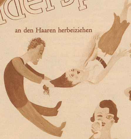
an den Haaren herbeiziehen