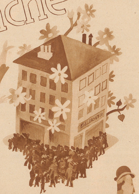
das Geschäft blüht