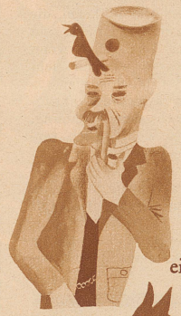
einen Vogel haben