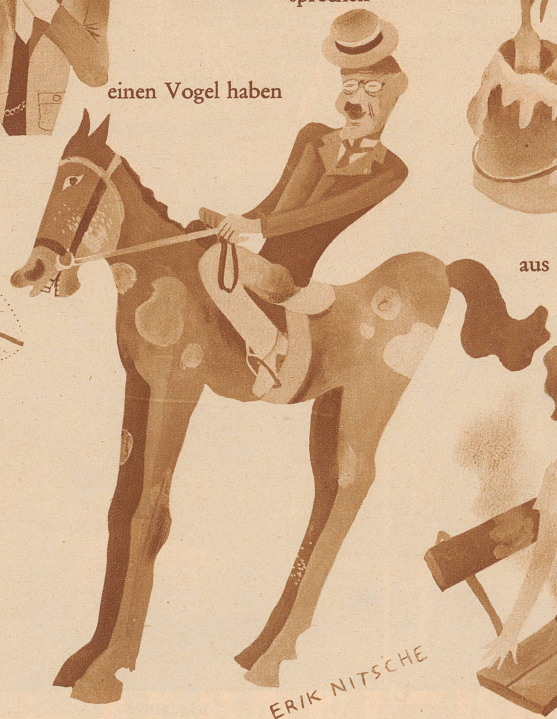
auf dem hohen Roß sitzen