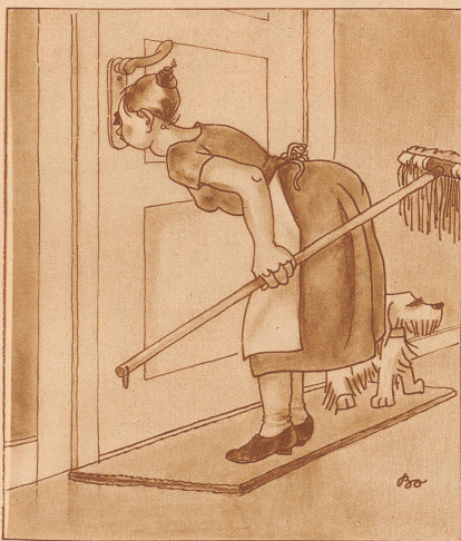
Goethe: «Zwar weiß ich viel, doch möcht ich alles wissen!»