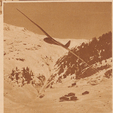
So turnt er jetzt, – mit seinem Segelflugzeug. Hier ist er über dem Davoser-See