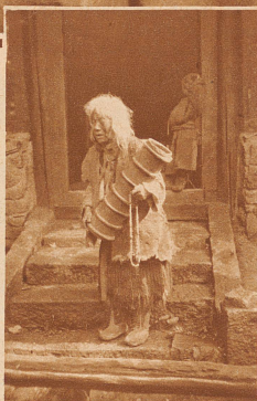
80jährige Klosterfrau mit ihrem Holzgefäß, in welchem Buttertee hergestellt wird