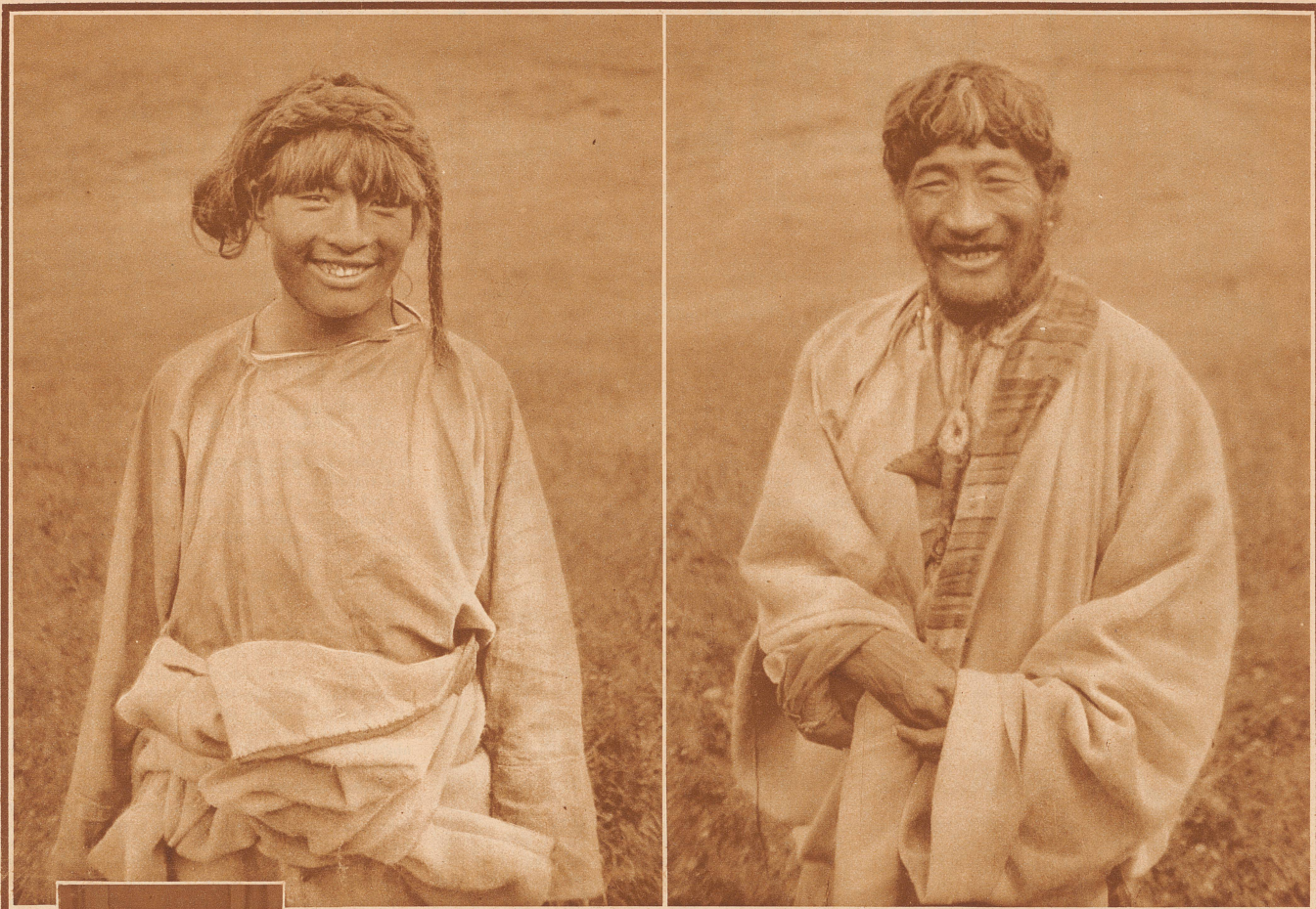
Freundliche Hirten auf einem blumigen Hochalpental von 4200 Meter