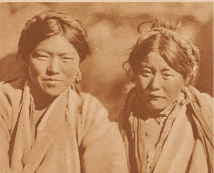
Rotwangige Hirtenmädchen aus Ost-Tibet, die wie die Männer auf Karawanenreisen die Yaks über die vereisten Hochpässe treiben