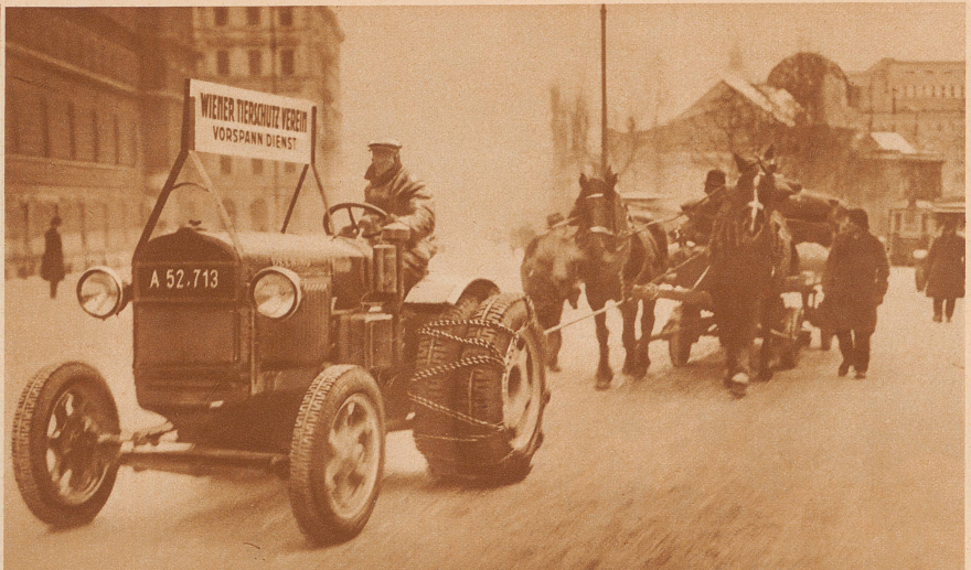
Winterhilfe für die Pferde. Die Wiener Tierschutzorganisation ist besonders gut ausgebaut und leistet wirksame Hilfe; in den letzten kalten Wochen hat sie die gute Idee gehabt, Fuhrwerksbesitzern unentgeltlich Traktoren für den Vorspanndienst zur Verfügung zu stellen, um den Pferden das schwere Ziehen auf den vereisten Straßen zu erleichtern