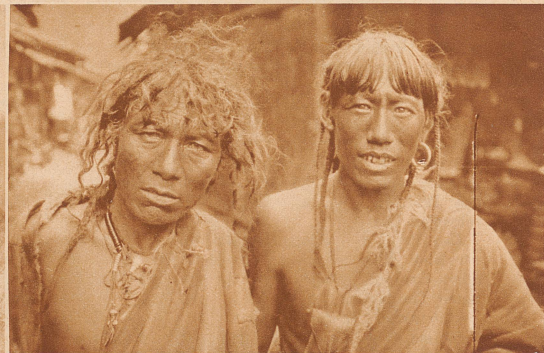
Tibetische Karawanen-Männer auf dem chinesischen Markt in Tatsicula, Ende November