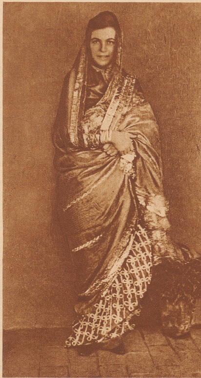
Der Backfisch, der allein nach Indien reiste:

Da, nach dem Abendessen — wir waren inzwischen nach Hause zurückgekehrt, und ich hatte mich bereits in meine Zimmer zurückgezogen —, kam der kleine Diener aufgeregt zu mir gelaufen, ich solle zum «Herrn» vor das Haus kommen. Ich trat in den Garten hinaus, wo ein paar geflochtene Sessel blaß im Mondenschein standen. Der Himmel