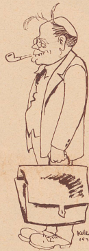
Karl Radek in der Karikatur von Kelen

An der Abrüstungskonferenz ist als Mitglied der sowjetrussischen Delegation Karl Radek aufgetaucht, der die Schweiz vor 15 Jahren mit dem berühmten plombierten Wagen verlassen hat, der ihn, Lenin und andere russische Revolutionäre direkt nach Rußland brachte. Die Kriegsjahre bis 1917 hat Radek größtenteils in Bern verlebt, wo er unter dem Pseudonym «Parabellum» die Leitartikel der Berner «Tagwacht» schrieb und allabendlich im Volkshaus sprach. Inzwischen hat Karl Radek die Höhen und Tiefen des politischen Kampfes erfahren, hat im Krenl als erster Pressechef der bolschewistischen Regierung amtiert, in Deutschland die Vorbereitungen zur Revolution geleitet, wurde dann als Gegner der neuen Richtung Stalins zusammen mit anderen Oppositionellen nach Sibirien verbannt, ist dann aber zu der «Generalinie» zurückgekehrt und arbeitet jetzt wieder in Moskau im Redaktionskollegium des Regierungsblattes, der «Iswestija». Die Schweiz hat ihm, der als Journalist die Abrüstungskonferenz besuchen sollte, die Einreisebewilligung nicht erteilt, worauf er in letzter Minute zum Mitglied der russischen Delegation ernannt wurde und so als Diplomat Schweizer Boden betreten konnte. Nun schreibt er von Genf aus für die «Iswestija» seine höchst ironischen Berichte über die «Abrüstung der anderen».