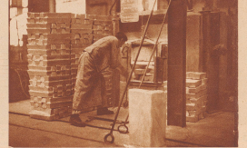
Das aus den Schmelzöfen kommende flüssige Metall wird in kleinen Gefäßen zu Büren gegossen, die man Masche nennt. Die erkalteten Masse kommt hernach in einen Gießmaschinen, wo die Bild zeigt. Aus diesem Öfen erst wird das Metall in genügender Einhaltbarkeit gewonnen.