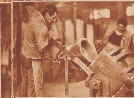
Aus dem Umarmelöfen geschöpftes Metall wird hier mittels einer kippbaren Kollie zu schweren Walzwaren gegossen