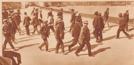
Schiebeweg, Müde verlassen die einen den Betrieb, während die anderen ihre Arbeit aufnehmen