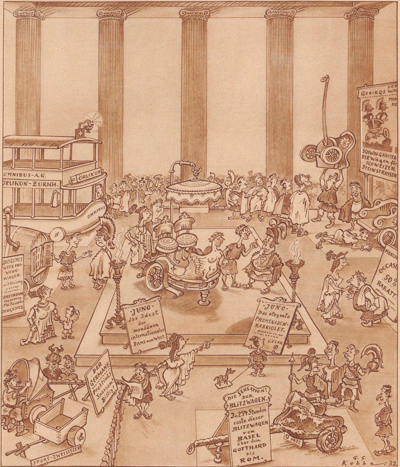
Für die «Zürcher Illustrierte» gezeichnet von George G. Kobbe