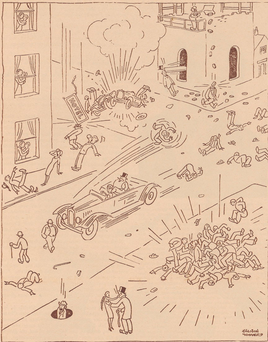
Wie sich ein Jurist das Paradies vorstellt!