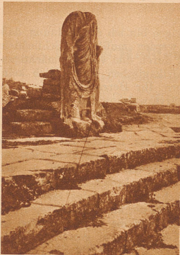
Dougga: Statuenreste auf dem Forum. Kraft und Wucht ist auch in diesem Rest einer Kolossalgestalt noch zu erkennen