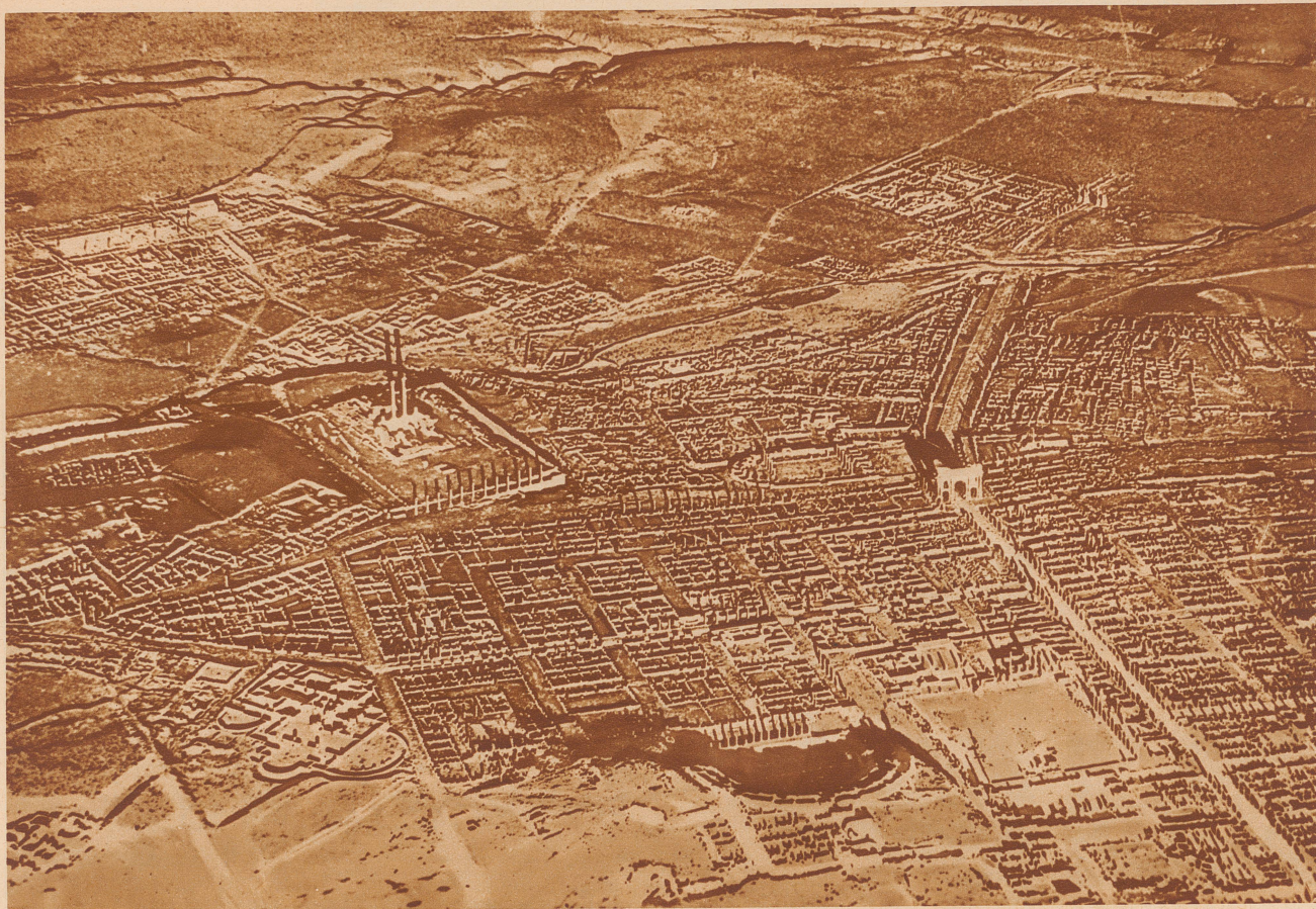
Diese Flugaufnahme mit ihren kubischen Häuserblocks zeigt nicht etwa die Brand-Ruinen einer amerikanischen Stadt, sondern Timgad, die Hauptstadt der einstigen römischen Provinz Afrika. Gegründet wurde diese gewaltige Stadt 100 Jahre n. Chr. Sie ging während der elfhundertjährigen Herrschaft der Araber allmählich im Wüstensande unter. Heute führt dort die französische Kolonialregierung gewaltige Ausgrabungen durch. Im Vordergrund unserer Flugaufnahme sieht man ein mächtiges Amphitheater und rechts einen Triumphbogen