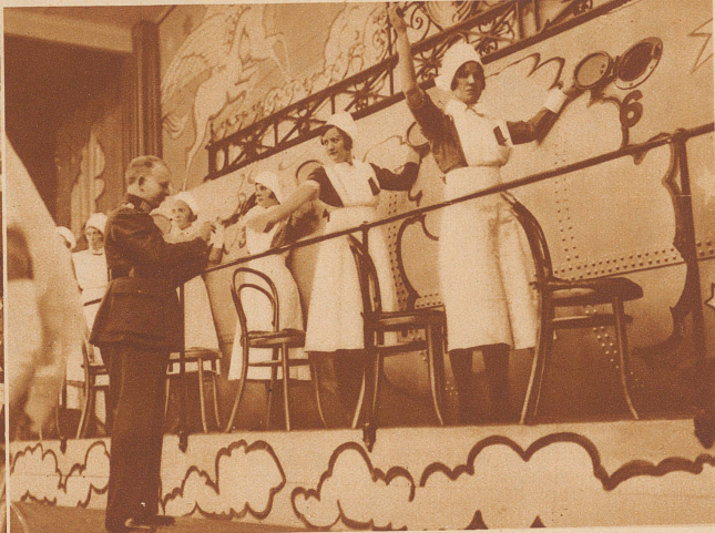
Die große irische Volkslotterie gibt einen Anteil ihres Gewinnes an die öffentlichen Spitäler ab. Es sind darum Krankenschwestern in Berufstracht, welche die endgültige Ziehung aus der riesigen Trommel in Gegenwart des Polizeipräsidenten des Irischen Freistaates am 14. März vornehmen