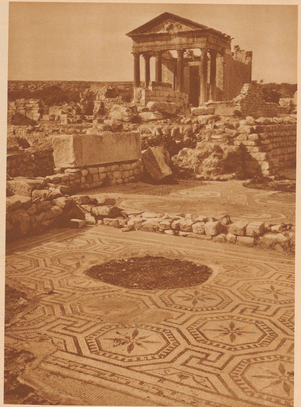
Dougga: Tempelreste und Mosaikuntenboden in einem Patrizierhaus. Ein Beispiel für die Pracht der Innenausstattung