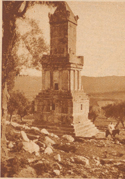
Mausoleum bei Dougga (Nord-Tunesien). Eine Grabkammer, die sich eine wohlhabende Familie vor 2200 Jahren errichten ließ

ches. Wie war das möglich, wenn doch heute nichts als Sandwüsten das Land überdecken? Es läßt sich aus den Notizen, die wir aus dem Altertum über Afrika haben, einwandfrei nachweisen, daß das Klima damals das gleiche war, wie heute noch. Der Grund des gewaltigen Gegensatzes zwischen einstiger Fruchtbarkeit und heutiger Verödung liegt darin: die Römer haben es verstanden, die Wüste mit künstlichen Mitteln in Fruchtländ umzuwandeln. Wir sind heute genau orientiert, wie sie dieses Zauberwerk vollbrachten, das eine der größten Kulturthaten der ganzen Weltgeschichte ist. Die Römer haben zwar noch nicht die Kunst verstanden, dem Sande Quellen zu entlocken, wie das die moderne Technik tut; aber sie kannten ein Wort und haben es angewandt: ratio-