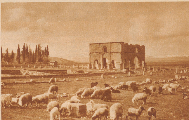
Vor den Schneebergen des Atlas stehen wuchtig und massig die Ruinen der römischen Prachtbauten. Triumphbogen bei Lambesis