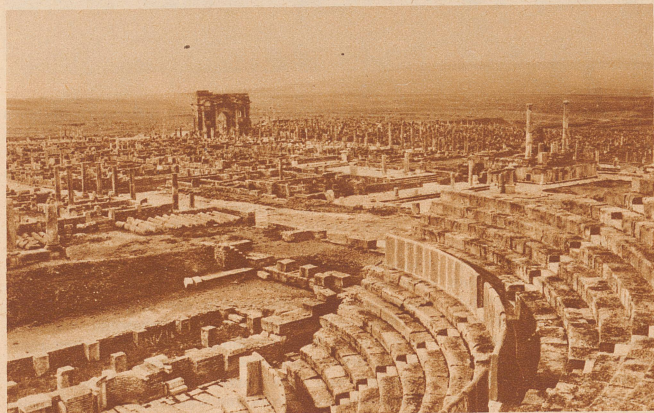
Timgad: Die Sitzreihen des Amphitheaters, die uns wie ein Ausschnitt aus einer modernen Sport-Arena erscheinen. Im Hintergrund der Triumphbogen

Kriegshetzer M. Porcius Cato Censorius ganz und gar nicht, sondern nach seiner Ansicht war Rom erst dann sicher, wenn Karthago dem Erdboden gleichgemacht wurde. Jedesmal nun, wenn er im Senate eine Rede hielt, schloß er sie mit folgenden