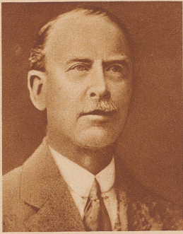
Seit 7 Jahren war der englische Forscher Oberst Fawcett

verschollen; von einer Expedition, die er mit seinem 21jährigen Sohn und dessen Freund ohne weitem Schutz in das wilde Gebiet des Matto Grosso in Brasilien unternahm, war er nicht mehr zurückgekehrt. 1927 erfuhr ein Brasilianer, die drei Weißen seien von den Indianern des Matto Grosso erschlagen und gefressen worden. Vor wenigen Tagen kam nun aus Rio de Janeiro die Nachricht, daß Oberst Fawcett von einem Schweizer Großwildjäger namens Rattin durch Zufall als Gefangener eines Indianerstammes entdeckt wurde; die Londoner Geographische Gesellschaft hat sich daraufhin an den englischen Gesandten in Rio gewandt, welcher Schritte zur Befreiung des Forschers einleiten wird